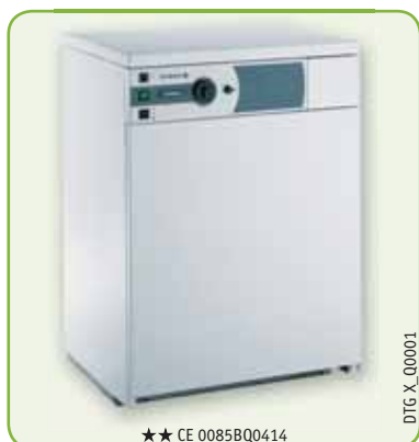
★★ CE 0085BQ0414